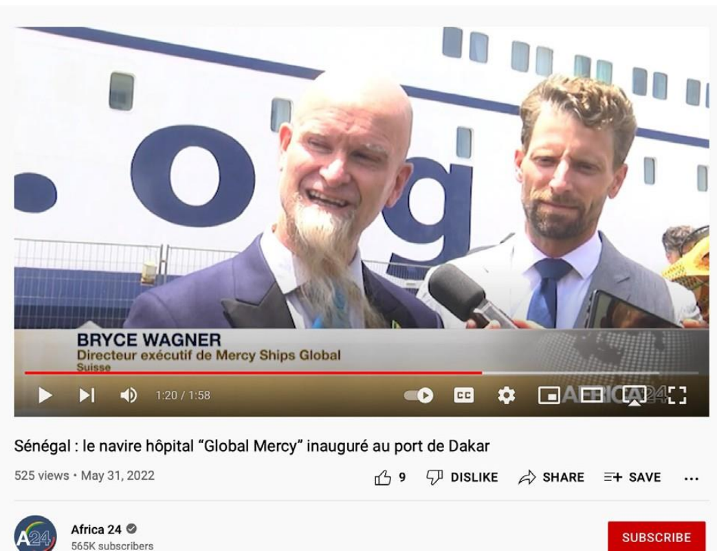
AFRICA 24 TV